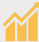
Dôstojná práca a ekonomický rast