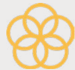
Partnerstvá za ciele

Podporujeme a sme členmi Business Leaders Fóra a iniciatívy Slovensko Digital. Sme signatármi Charty diverzity. V prípade potreby pomáhame pri hľadaní práce uchádzačom, ktorí stratili zamestnanie z dôvodu ohlásenia korupcie. Ako člen skupiny Alma Media sme súčasťou ESG cieľov, ktoré sú k dispozícii na https://www.almamedia.fi/en/sustainable-almamedia/